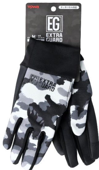
EG-015 WINDPROOF(ウインドプルーフ)

EXTRAGUARD(エクストラガード)シリーズはこれまで東和が追求してきた機能性に加え、デザインとの調和を追求することで新しく生まれ変わったブランドです。